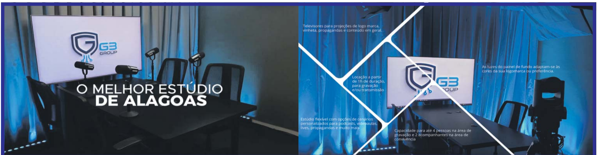
Televisores para projeções de logo marca, vinheta, propagandas e conteúdo em geral.

Para o presidente da Embratur, Bruno Reis, a rota aérea fomenta não apenas o turismo, mas também os negócios e a economia do Estado. “Temos adotado uma política de sinergia com os atores locais, como o Paraná. E nosso plano é um incremento da conectividade aérea com voos descentralizados para além do eixo Rio-São Paulo”, explicou. “Esse estímulo a voos diretos internacionais se reflete na atração de investimento internacional, na exportação e importação e vinda de novos negócios. (AENPR)