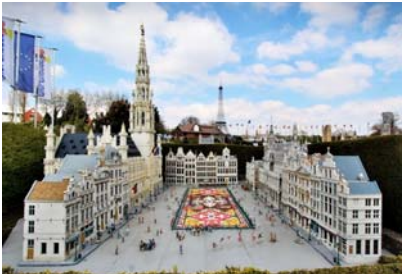
Mini-Europa - Grand-Place Bruxelles Belgique

O Paraná é um destino destaque na Europa. Atrativos e pacotes turísticos ao Estado estão sendo transmitidos em telas e totens promocionais em Madri e outros locais da Espanha. A divulgação é feita pela Viajes El Corte Inglés – líder no setor de agências de viagens no país ibérico – junto da Logitravel, outra empresa do grupo, que promove os destinos paranaenses em suas filiais, nos aeroportos de Barajas (em Madri), El Prat (Barcelona) e em grandes redes de lojas.