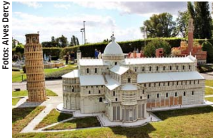
Mini-Europa - Torre de Pisa (Itália)