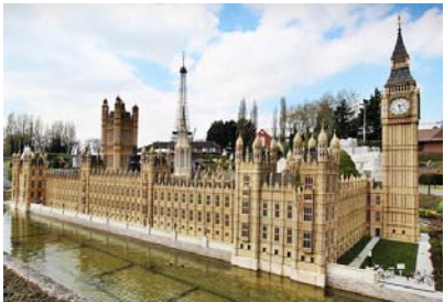
Mini-Europa - Big Ben (Londres)