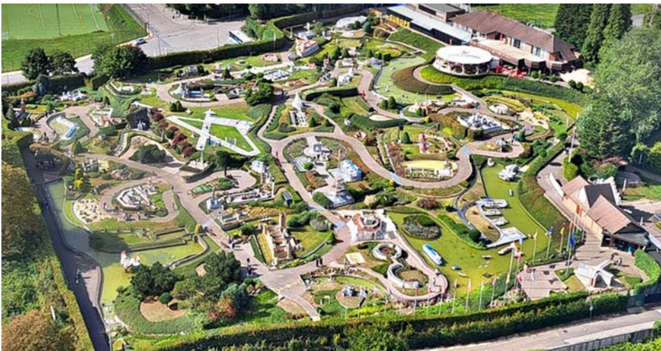
Mini-Europa - Bruxelles Belgique

Por trás do mundo em miniatura dos monumen-