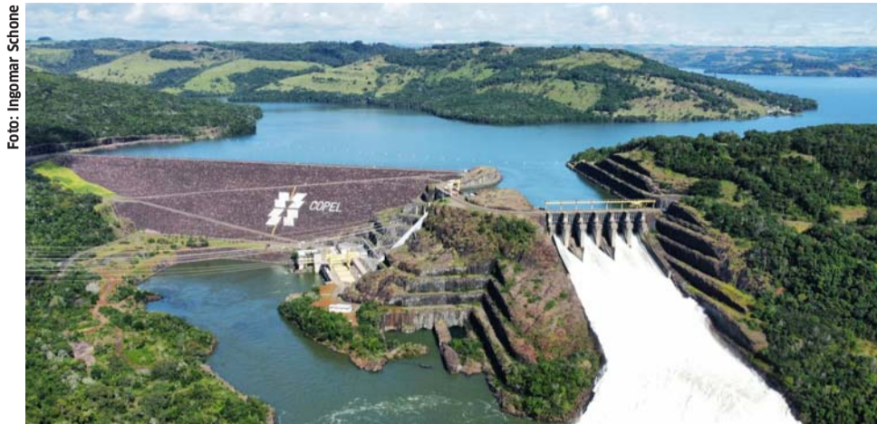
Usina Governador Ney Braga

Além das mudanças provocadas pelo funcionamento das turbinas, em