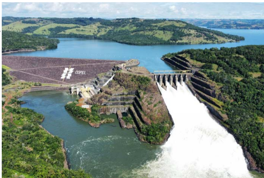
Usina Governador Ney Braga

Com a chegada da primavera e a elevação das temperaturas, rios e represas se tornam destinos ainda mais procurados para atividades de lazer. Nessas áreas, próximas a barragens de usinas hidrelétricas, a Copel reforça a importância de respeitar os cuidados e restrições de segurança. As orientações incluem evitar a navegação e a pesca em áreas sinalizadas por placas, boias ou cordões de isolamento. O acesso a esses locais é restrito às equipes da companhia, justamente para prevenir acidentes e preservar a operação das usinas.