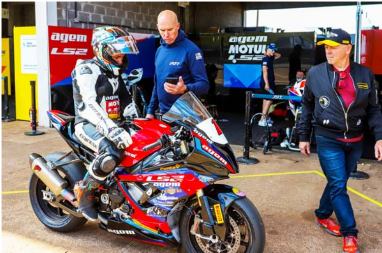
Gandola quer ampliar vantagem e se aproximar do tricampeonato

“Vamos dar tudo para ganhar, porque essa é a nossa ideia. São duas etapas decisivas e cada ponto vale. Gosto muito de