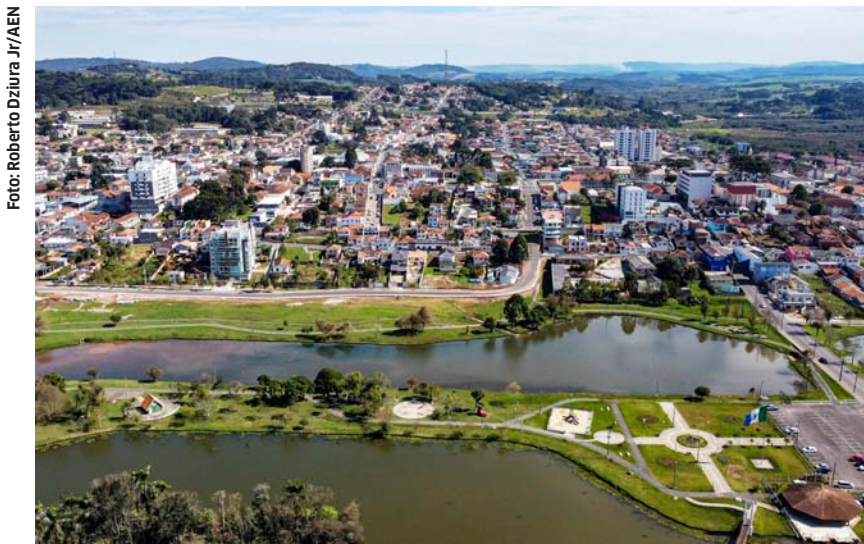
Castro, em foto atual. No primeiro censo, em 1872, era a cidade mais populosa do Paraná

Um detalhe importante do painel interativo é que o primeiro levantamento censitário de abrangência nacional do Brasil, realizado em 1872, foi conduzido antes da República. Este censo levantou os habitantes no País e estados de pessoas livres ou escravizadas - a escravidão perduraria oficialmente até 1888, embora já houvessem leis que buscassem extingui-la. Este censo também quantificou dados por cor, sexo e outras variá-