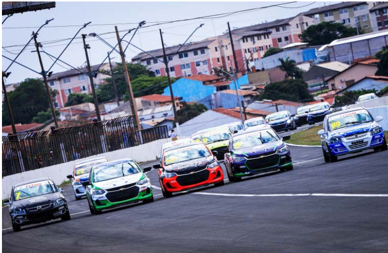
Race Cup corre a Cascavel de Prata às 11h de sábado

Será um fim de semana intenso de treinos e corridas, oferecendo ao público quatro competições distintas. Seriam cinco, pela programação inicial. A noite de sexta-feira marcaria a primeira edição da Cascavel de Ouro Light, com grid exclusivo dos carros da classe Light da Gold Turismo, os mesmos que integram campeonatos de velocidade na terra. Contudo, no início de outubro, os 11 carros inscritos na Light foram incorporados ao grid da Cas-