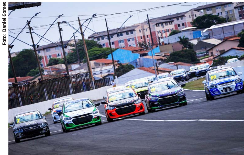
Race Cup corre a Cascavel de Prata às 11h de sábado

Será um fim de semana intenso de treinos e corridas, oferecendo ao público quatro competições distintas. Seriam cinco, pela programação inicial. A noite de sexta-feira marcaria a primeira edição da Cascavel de Ouro Light, com grid exclusivo dos carros da classe Light da Gold Turismo, os mesmos que integram campeonatos de velocidade na terra. Contudo, no início de outubro, os 11 carros inscritos na Light foram incorporados ao grid da Cas-