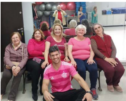
Por Marian - Colaboradora jornal Polo Brasil

possível enfrentar o desafio com informação, coragem e esperança.