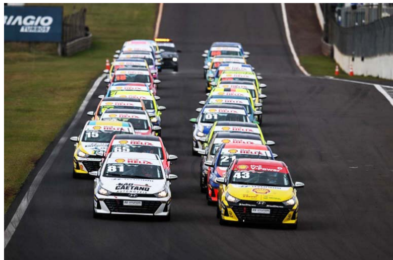
Copa Hyundai HB20 acelera às 16h de sábado, em prova especial de duas horas

da Cascavel de Prata, com os carros da Race Cup, e etapas dos campeonatos da Copa FRUM Gold Classic e da Copa Hyundai HB20. O evento é realizado por Masso Sports, Automóvel Clube de Cascavel e Gold Racing e conta com apoio da Secretaria de Turismo do Estado do Paraná, da Masso Alimentos, da Guatá Madeiras e do COMTUR. Ingressos, credenciais de box e passes de estacionamento estão disponíveis no site da Eventos Aqui, com preços a partir de R$ 20,00.