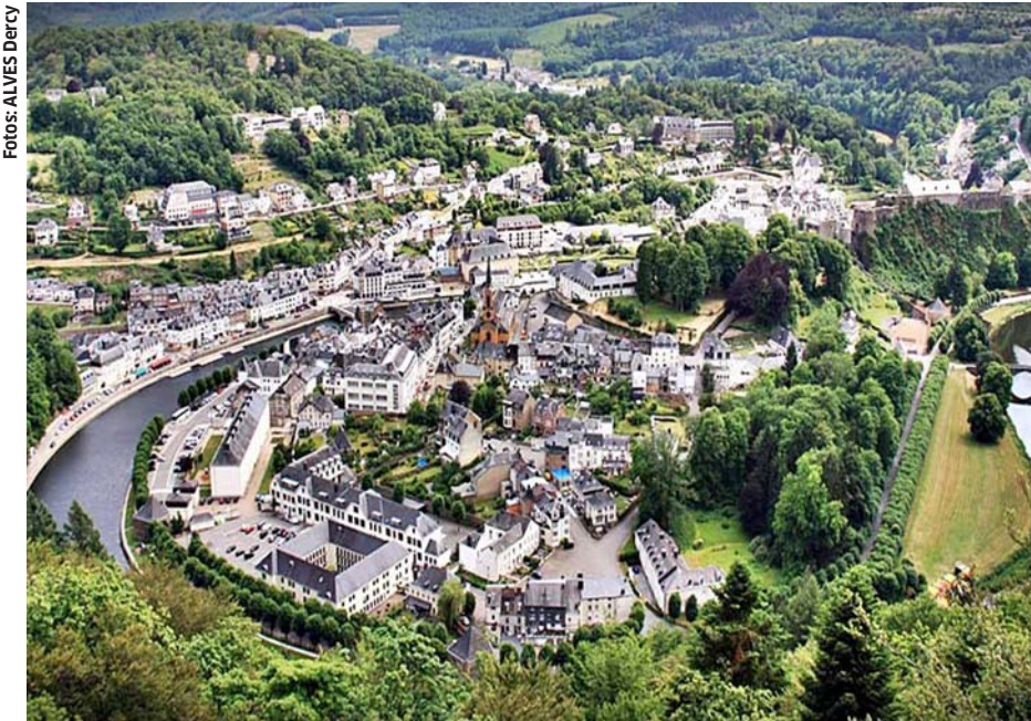
Bouillon - Bélgica - Cidade Turística Milenar