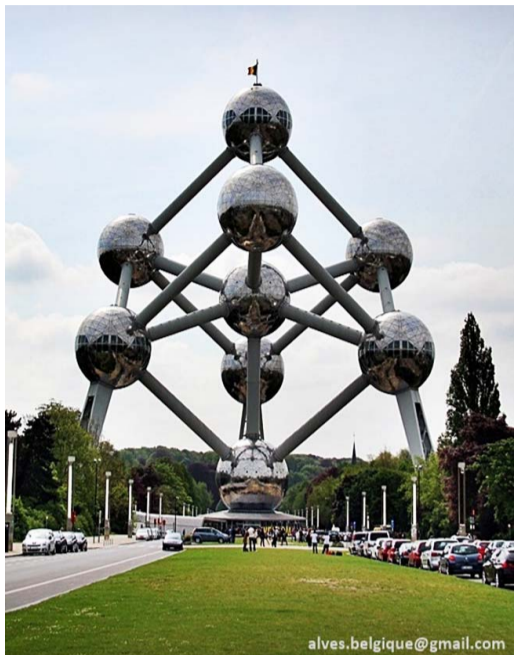
Atomium Bruxelas Bélgica

Este é um dos momentos mais marcantes da agenda cultural de Natal em Curitiba: a união de patrimônio histórico (a catedral neogótica inaugurada em 1893).