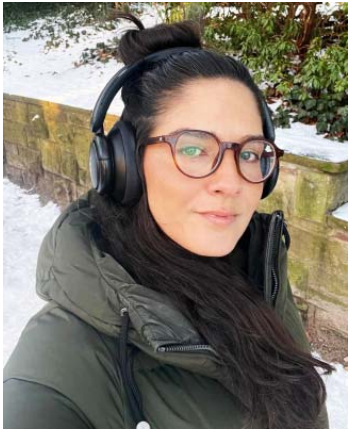
Por Fernanda Raasch

Há 3 anos e meio, quando me mudei para a Alemanha em pleno verão, e após ter vivido um verão naquele ano no Brasil, era difícil entender o porquê as pessoas com quem eu convivia nessa época se mostravam tão assustadas quando eu optava por passar um dia de sol em casa e não vivendo aquele dia de verão intensamente. Hoje, vivendo o meu quarto inverno na Alemanha, eu entendo! O outono ainda nem foi embora oficialmente e já sentimos as paisagens e o clima mudando. Temperaturas negativas, neve e escuridão, já que os dias são mais curtos, amanhecendo por volta das 8 da manhã e escurecendo às 4 da tarde. Já quase não ve-