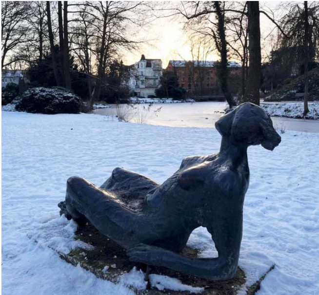
Hamburgo - Alemanha

mos verde nas árvores, pois a esta altura todas as folhinhas já caíram. A partir de agora, todos já sabem que até a próxima primavera a vida fica mais difícil. Há um senso coletivo e histórico de que é um momento para se cuidar e se preparar para o inverno. É importante se manter forte para os meses seguintes. Além de toda a mudança no guarda-roupa para receber o frio, nos apegamos também aos pequenos rituais de inverno, e eles se tornam essenciais para manter a saúde