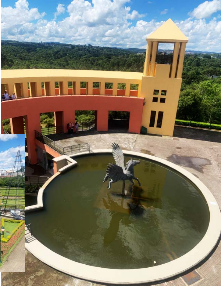
Por Rita Gusmão

Hoje, o Parque Tanguá continua sendo um dos espaços preferidos de moradores e visitantes, reunindo lazer, contato com a natureza e uma história de recuperação ambiental que segue alinhada à identidade ecológica da capital.