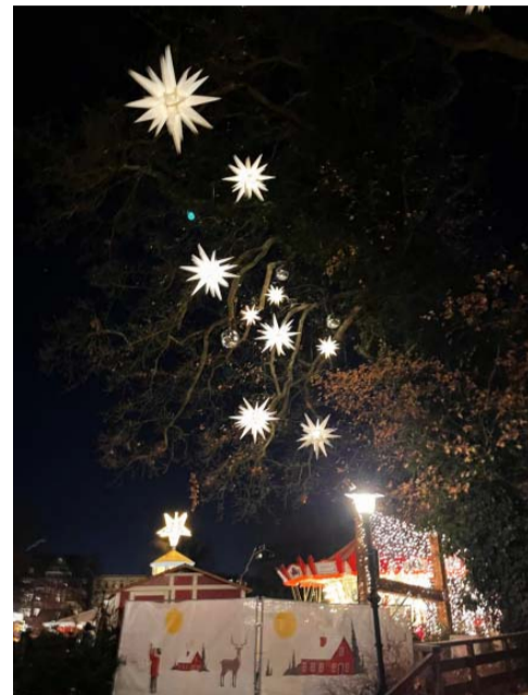
Hamburgo - Alemanha