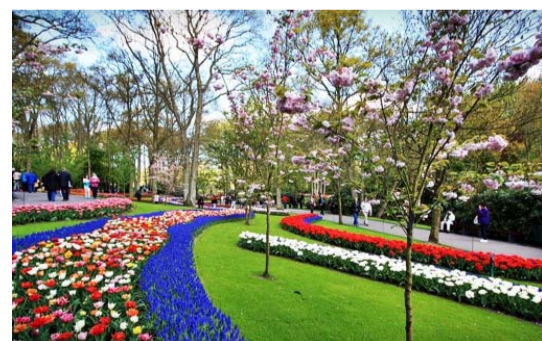
Jardins de Tulipas de Keukenhoff - Holanda

diferentes de tulipas, que oferecem uma experiência visual espetacular em seus