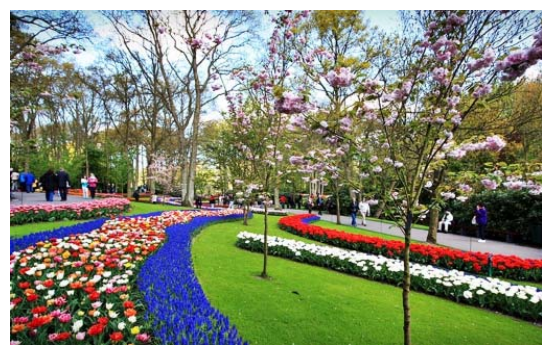
Jardins de Tulipas de Keukenhoff - Holanda