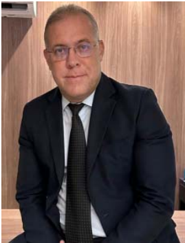
WhatsApp 82 98113-2350 alvarocostaadvogado@gmail.com

Definitivamente, o país não pode abrir mão de uma das ferramentas mais eficazes e seguras para identificar criminosos e prevenir novos delitos, principalmente os sexuais. A expansão do banco de DNA é, acima de tudo, um compromisso com a justiça.