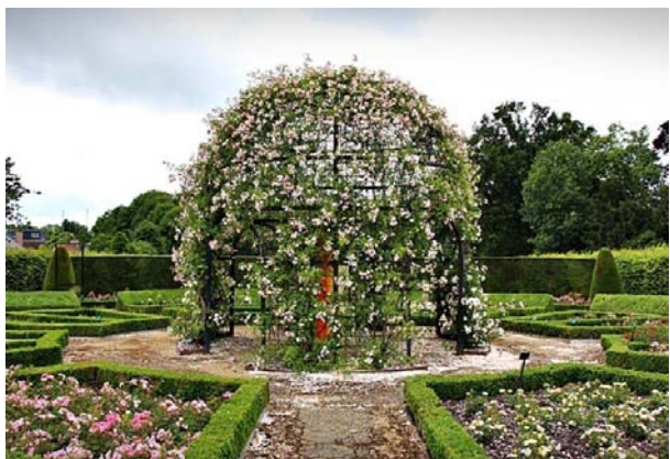
Jardins de Rosas do Castelo Coloma - Sint-Pieters-Leeuw - Bélgica