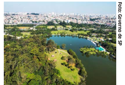
Parque ecológico do Tietê

Mais do que uma celebração simbólica, o encontro pretende abrir espaço para a troca de experiências e a apresentação de soluções concretas, de tecnologias a projetos socioambientais, capazes de fortalecer políticas públicas e ampliar o