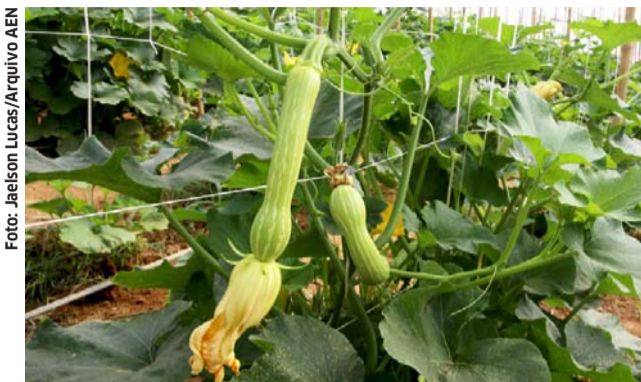
Produção de abobrinha se consolida no Paraná e movimentou mais de R$ 100 milhões

Segundo o Deral, em se tratando de preços, o setor enfrenta desafios climáticos. Os dados apontam que a estiagem recente elevou