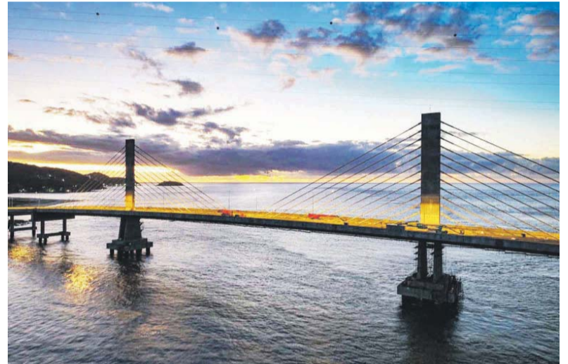
Sistema de iluminação da ponte começa a ser instalado nos mastros, etapa essencial para garantir visibilidade e segurança durante o período noturno