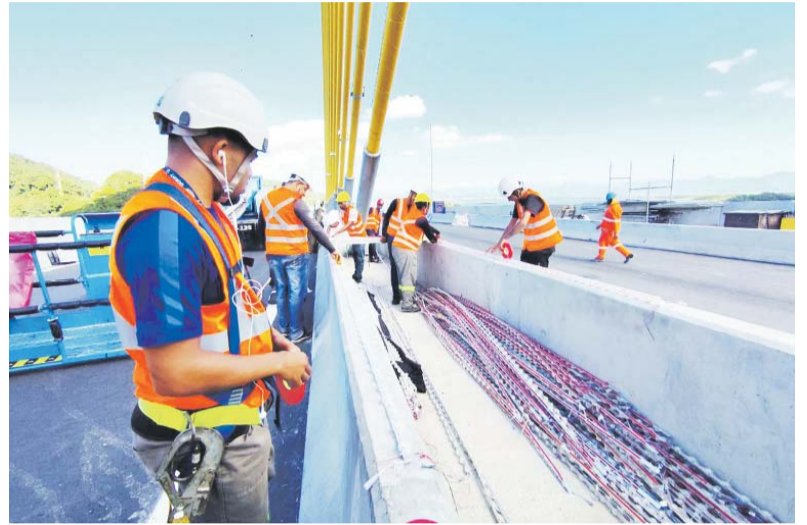
Acesso pelo lado de Matinhos recebe ajustes finais para integração completa da ponte ao sistema viário