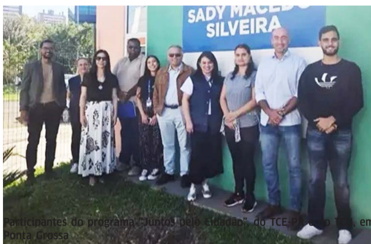
Participantes do programa “Juntos pelo Cidadão” do TCE-PR e do TCU, em Ponta Grossa

Pela tarde, os técnicos dos tribunais atuam como mediadores entre os participantes da atividade, que identificam oportunidades de melhoria nos serviços ava-