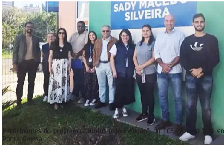
Participantes do programa "Juntos pelo Cidadão" do TCE-PR e do TCU, em Ponta Grossa

Pela tarde, os técnicos dos tribunais atuam como mediadores entre os participantes da atividade, que identificam oportunidades de melhoria nos serviços ava-